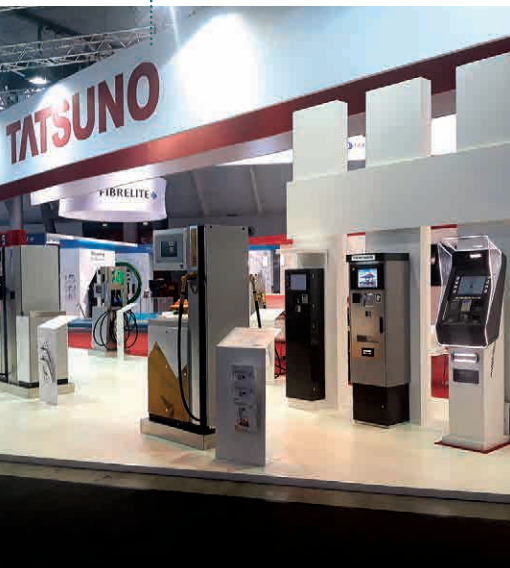
STAND TATSUNO CON TERMINALE MAC 4.0