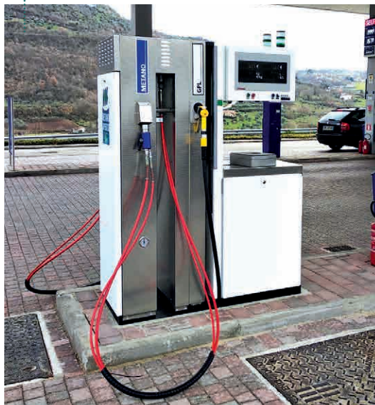
EROGATORE TATSUNO CON GPL E METANO